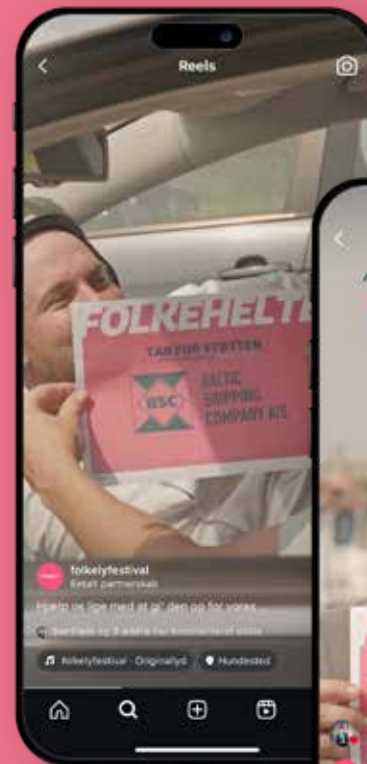
Branding via små sjove videoer lavet for at hylde Folkelys Folkehelte