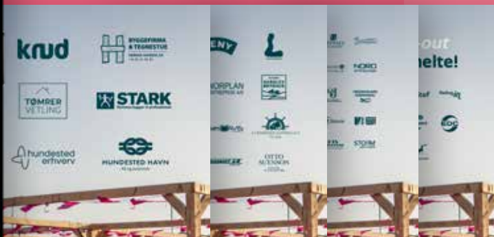
Branding via opslag og story

Instagram 2600 følgere Facebook 3600 følgere